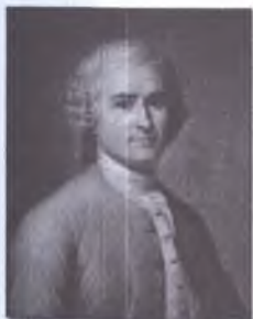
Jan Jak Russo (1712—1778)

Bolalarni tabiatni ssvishga va uni o'rganishga bo'lgan qiziqishini orttirish yo'llarini ko'rsatdi. Bolalardagi kuzatish qobiliyatini oshirish, fikrlash xususiyatini rivojlantirish, tabiat haqida to'g'ri tushunchalarga ega bo'lish, tevarak-atrofdagi voqea-hodisalarni payqay bilish ruhida tarbiyalash kerakligini uqtirdi.