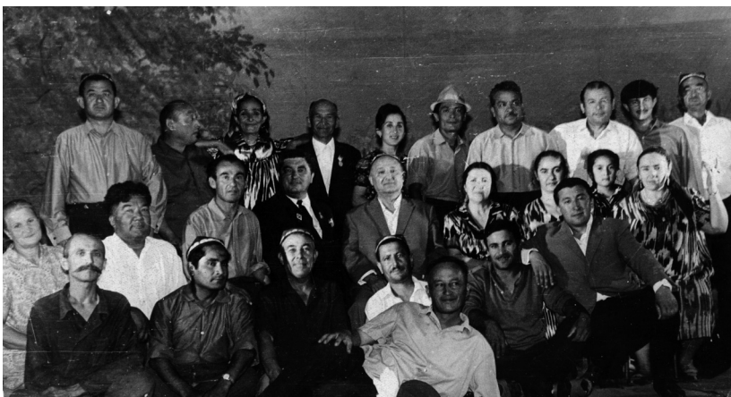
Театр коллективи даврасида.