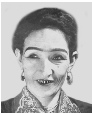
Ўзбекистон халқ артисти Бикажон Раҳимова