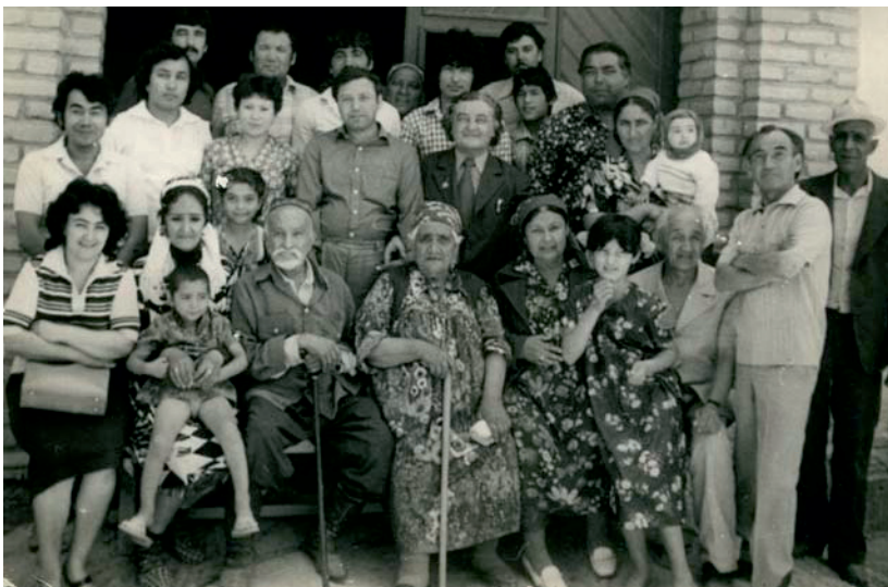
А. Отажоновлар хонадони