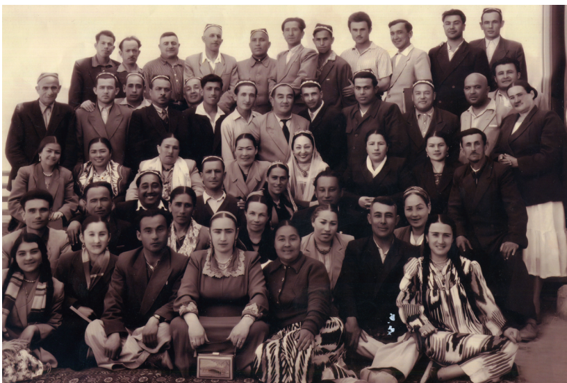
СССР халқ артисти Тамарахонум даврасида.