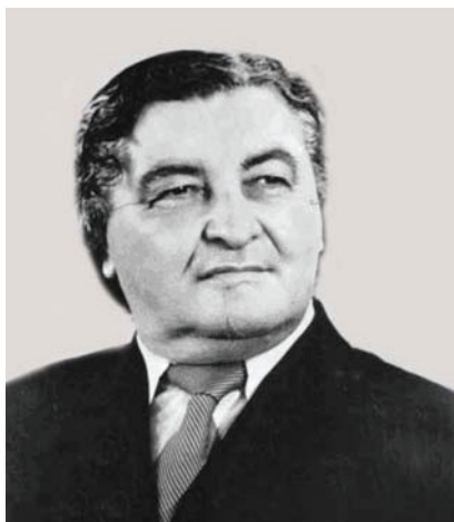
Ўзбекистонда хизмат кўрсатган артист, композитор Абдушариф Отажонов