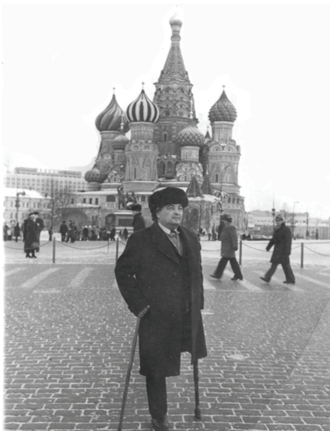
Композиторлар съездида. Москва