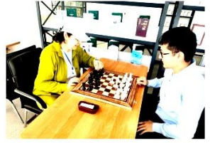
Keng ko'lami islohotlar — aniq natijalar

Mamlakatimizda jismoniy tarbiya va sportni rivojlantirish davlat siyosatining ustuvor yo'nalishlaridan biriga aylangan. 2026-yil 7-aprel kuni Prezidentimiz Sh.Mirziyoyev rahbarligida O'zbekiston videoselektor yig'ilishida bu boradagi muhim vazifalarni belgilab berildilar. Davlatimiz rahbari yig'ilish avvalida shunday dedilar: "Sport bu faqat musobaqa emas, balki sog'lom turmush tarzi, intizom, vatanparvarlik va mamlakat nufuzini namoyon qiladigan katta kuch".