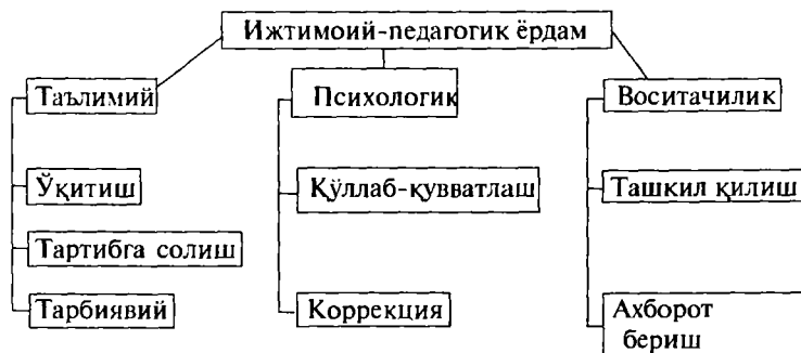
2-расм. Ижтимоий-педагогик ёрдам тизми

Ижтимоий педагогнинг оиладаги асосий фаолиятини ижтимоий педагогик ёрдам ташкил қилиб, бу ёрдам таълимий, психологик ва воситачилик кўринишларида намоён бўлади.