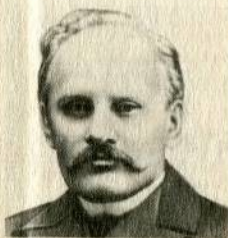
Алексей Александрович Шахматов (1864-1920)