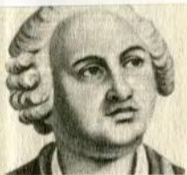
Михаил Васильевич Ломоносов (1711-1765)