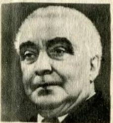
Виктор Владимирович Виноградов (1895-1969)

Велика бо бывает полза отъ ученія кнѣжнѣнаго; кнѣжнѣнаго бо кажеми и учими есмы пути покаянію, мудрость бо обрѣтаемъ и въздржане отъ словесъ кнѣжнѣныхъ; се бо суть рѣкы, напаяюще въселеную, се суть исходища мудрости; кнѣжнѣнаго бо есть неищѣтна глубина; сими бо въ печали утѣшаемы есмы, си суть узда въздржанію.