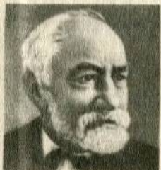
Алексей Иванович Соболевский (1856-1929)