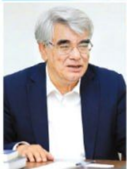
Usmon AZIM, O'zbekiston xalq shoiri